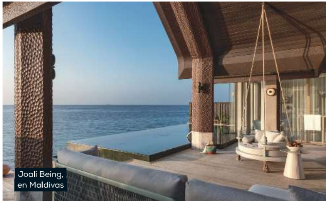
Joali Being, en Maldivas