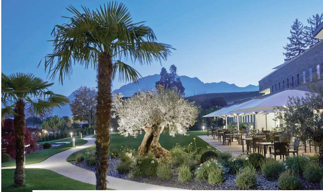
Izda., La Prairie Clinique, un edén en Suiza. Dcha., la cocina como medicina