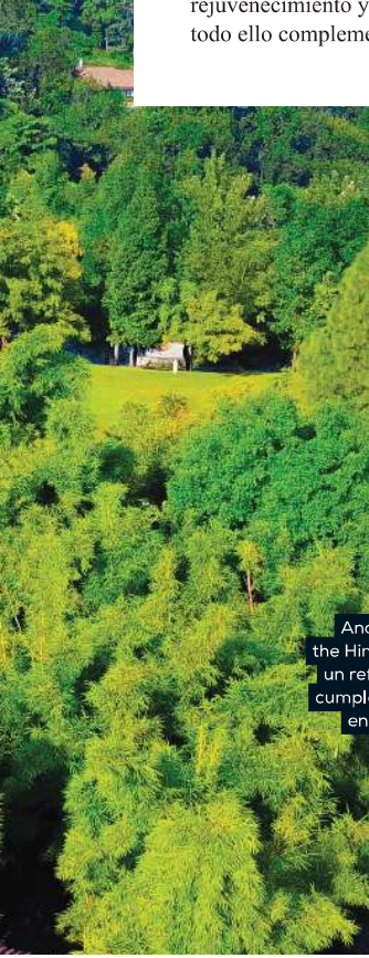
Ananda in the Himalayas es un refugio que cumple 25 años en 2025